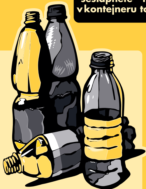
plastové nádoby a láhve, PET láhve (od nápojů)