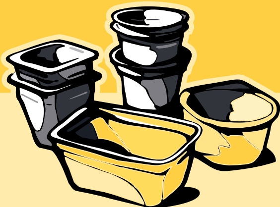
kelímky od jogurtů, krabičky od pokrmových tuků

PET láhve, prosím, sešlápněte - nezaberou v kontejneru tolik místa.