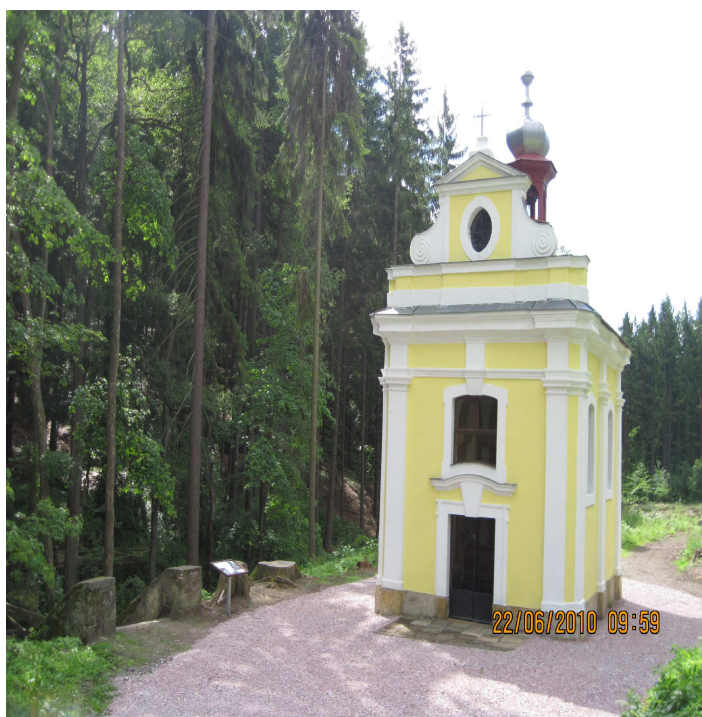
Kaple Jana Nepomuckého v Miletínských lázních.

Poutní mše svatá začíná v kapličce od 11.00 hodin.