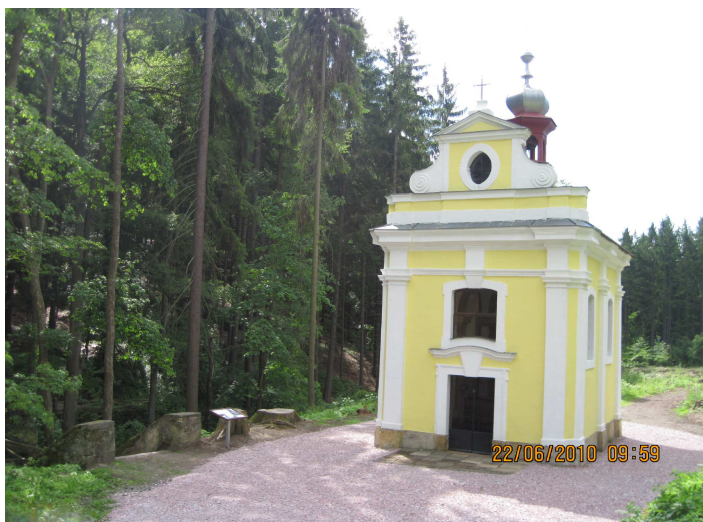
Kaple Jana Nepomuckého v Miletínských lázních.

Poutní mše svatá začíná v kapličce od 11.00 hodin.