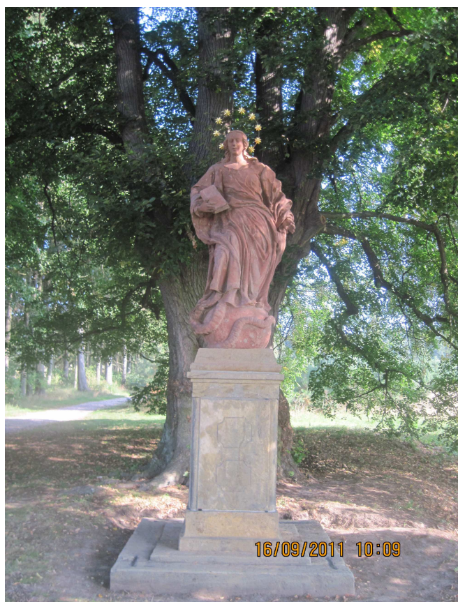
Zrekonstruovaná socha p.Marie Imalculáty na trase putování